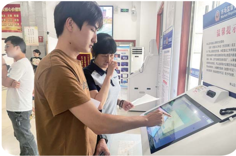
市民正在办理营业执照变更。

紧紧围绕以打造最优营商环境为目标,推动注册登记从数字化到智慧化的转变,全力打造更具吸引力和竞争力的营