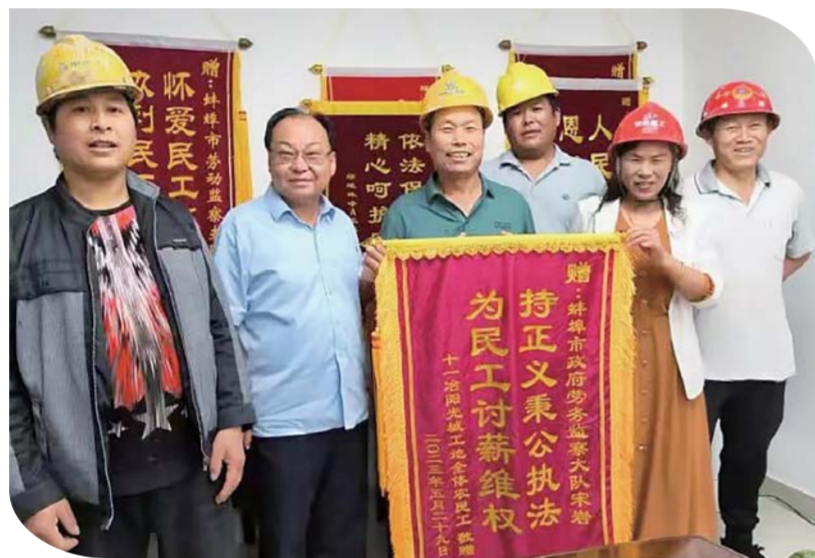
农民工送锦旗表示感谢。

粗看之下,这些材料似乎都没有问题。但富有经验的执法人员在仔细对比后发现了“猫腻”——