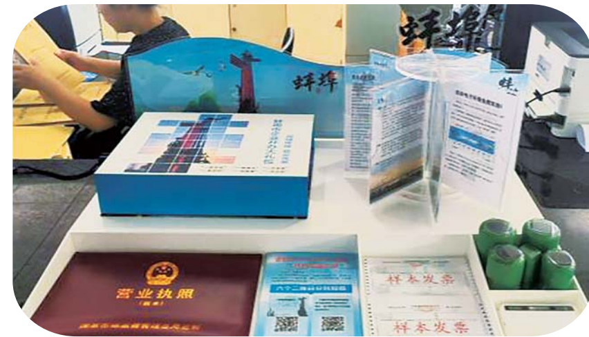
满满当当的“企业开办大礼包”2.0版。

据介绍，此次市场监管部门对“企业开办大礼包”的升级，主要围绕服务企业需求进行更新，将惠企政策精准推送到企业开办最前沿，方便企业在成立之初就能了解、知晓我市相关政策，以便在今后的经营活动中充分利用，助推企业发展。