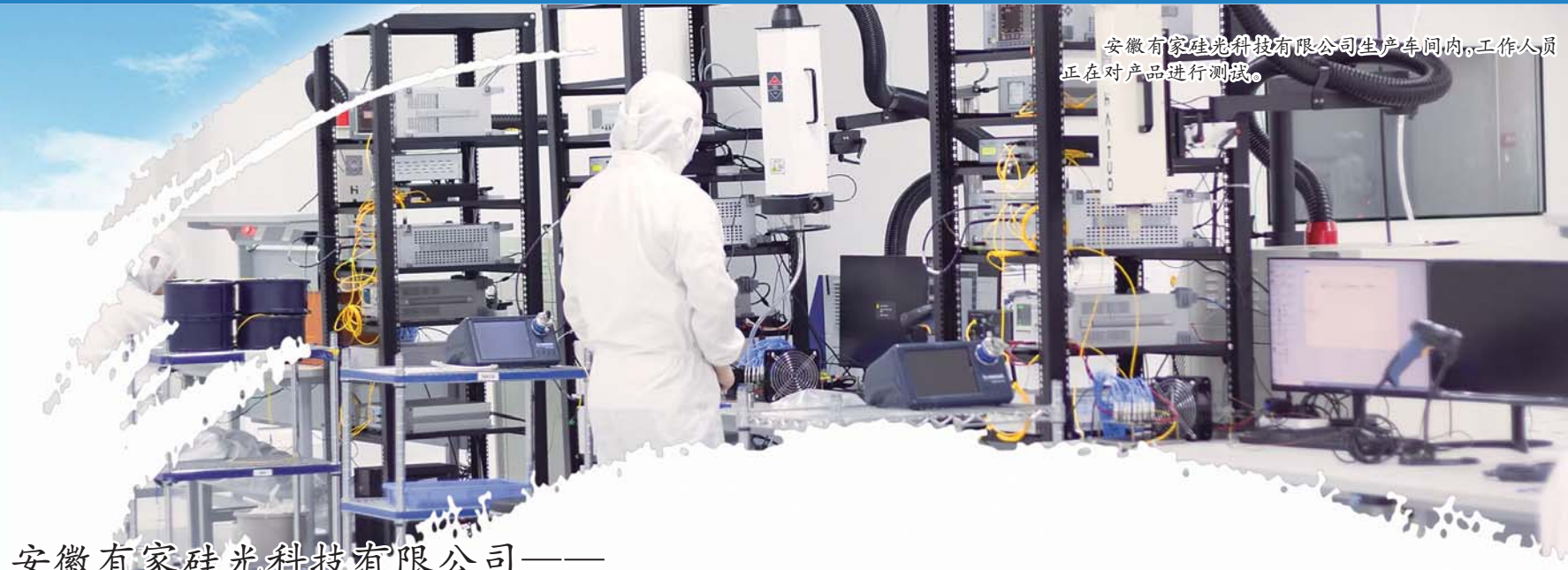
安徽有家硅光科技有限公司生产车间内,工作人员正在对产品进行测试。