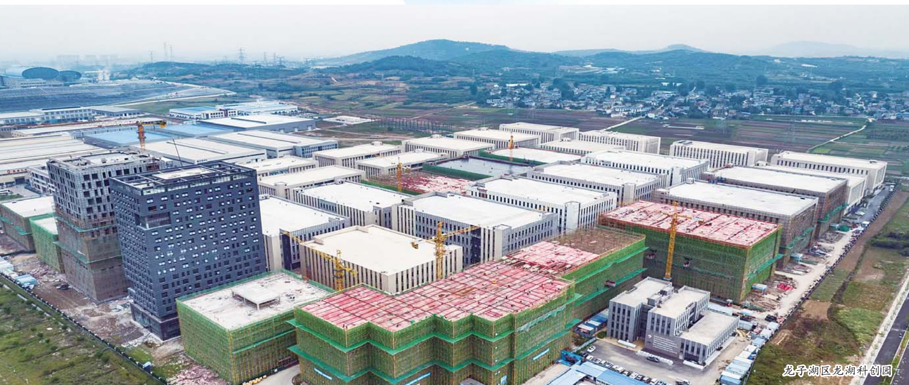
龙子湖区龙湖科创园