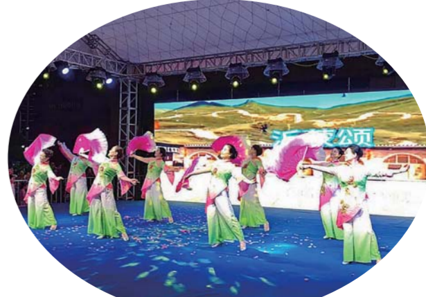
7月29日至8月2日晚间,固镇县2023年“大地欢歌 美好谷阳”群众广场舞纳凉晚会盛大举办。51个优秀群众文艺节目参加了展演,居民在欢声笑语中共享盛夏之乐。