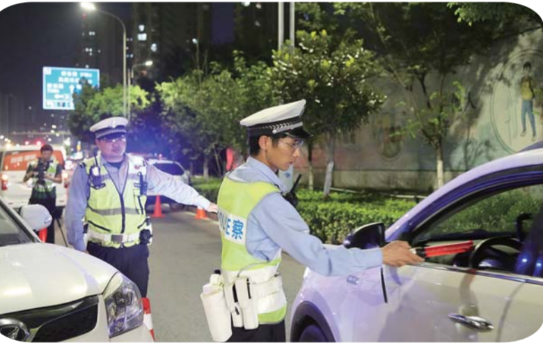
夏季交通安全整治行动现场。

本报讯(融媒体记者 何冲 通讯员 杨敬波 文/图)近日,根据全国公安机关夜治安巡查宣防集中统一行动安排,交警支队邀请本报记者随警作战,前往高速公路、城区路面一线,开展夏季交通安