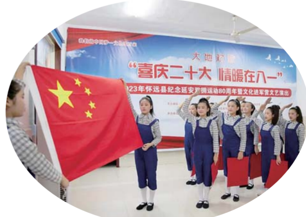
日前,怀远县组织开展了“我们的中国梦·文化进万家”系列活动——纪念延安双拥运动80周年暨文化进军文艺汇演。演员们用嘹亮的歌声和曼妙的舞姿充分演绎着军民鱼水情。