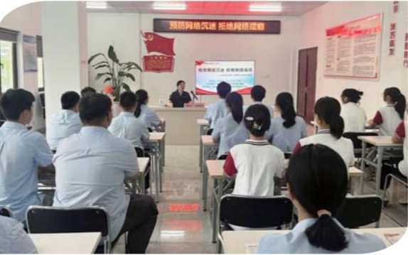
近日,蚌山区湖滨社区中心金恒社区新时代文明实践站联合蚌山区人民法院及新城滨湖学校举办“预防网络沉迷,拒绝网络成瘾”主题讲座,进一步增强学生群体的网络安全意识。