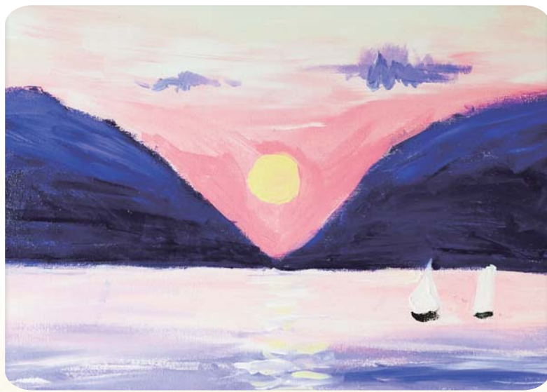
蚌山小学南山郇都校区 二(6)班 李逸轩 指导老师：高洁云

通过这件事，我深刻地意识到只有平时的日积月累，再加上实干，才能取得优异的成绩。指导老师：陈永翠