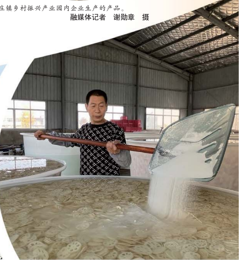
万福镇关圩村莲藕种植成为当地特色产业。