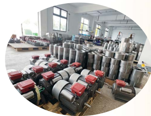
魏庄镇乡村振兴产业园内企业生产的产品。

2022年，魏庄镇乡村振兴产业园开建，11月投入使用，实现了当年立项、当年建设、当年使用、当年受益。目前园区一期已建成，共有5