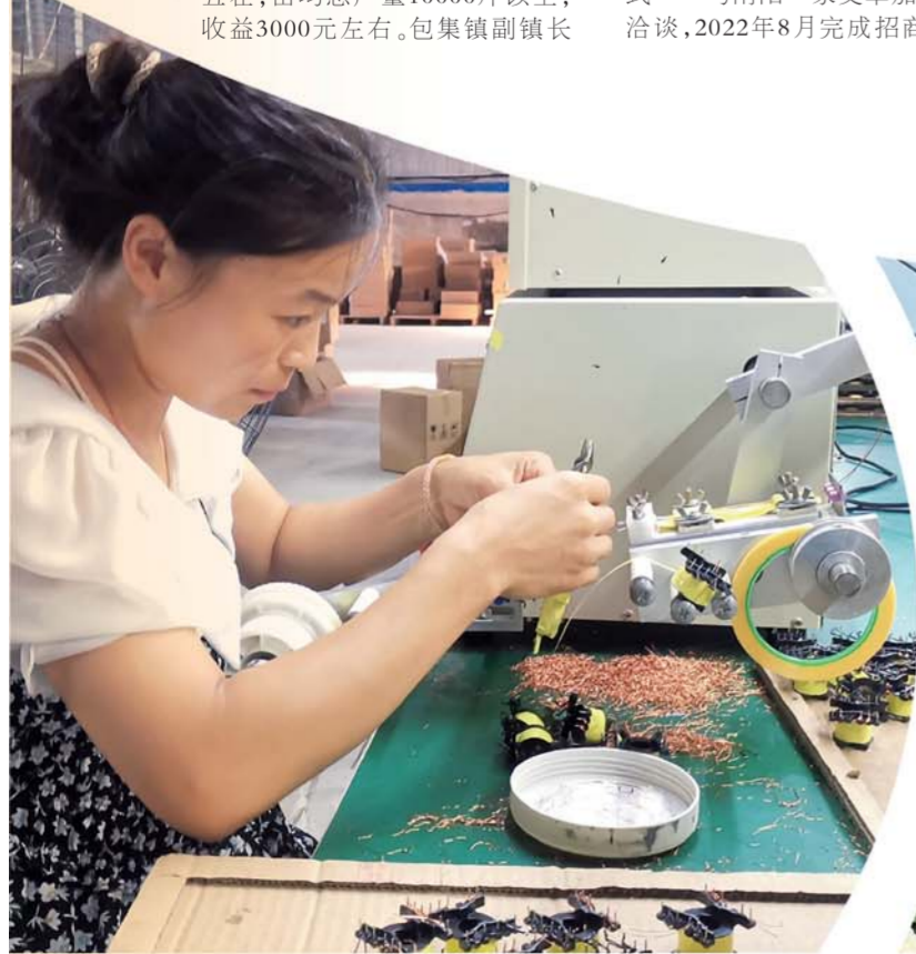
河溜镇乡村振兴产业园和联电子公司员工生产电脑配件。