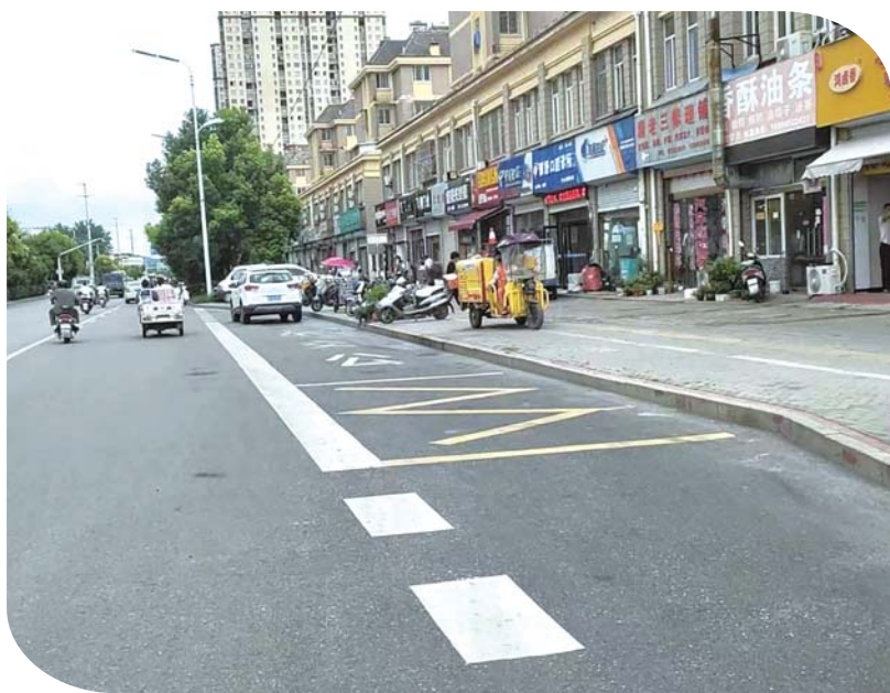
图为修复一新的路牙石。

今年以来，淮上区城管局聚焦城市管理的“小问题”“小隐患”，分片区安排工作人员对城区的路牙石现状情况进行排查，对发现的路牙石移位、下沉、缺失、破损等问题，立即安排工作人员进行修复。已安排工作人员修复、更换盛中路、双墩路、上河路等路段路牙石共计600余米。目前，城区路牙石整体使用情况正常，群众出行更加安心。