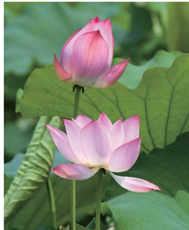
清风荷影

题”。俗话说：“小洞不补，大洞吃苦。”一个党员干部行稳致远、清正廉洁，必须严格遵守党的纪律规矩，久久为功、持之以恒，在党章党规党纪、宪法和法律的范围内干好本职工作，依法依规办事，全心全意为人民服务。要把严的基调、严的氛围、严的行动长期坚持下去，严在日常，严在平常，严在经常，身体力行严守一辈子。要从点滴小事小节做起，净化朋友圈交往圈生活圈，说老实话，办老实事，做老实人，守住纪律规矩的底线，守住拒腐防变底线，在新时代新征程中不断谱写人生新篇章。 全面从严治党的永远在路上，纪律建设没有休止符。作为党员干部特别是领导干部，心中应有纪律这把“戒尺”，犹如警钟长鸣、红线常在，才能心有所畏、行有所止。 （作者单位：固镇县纪委监委）