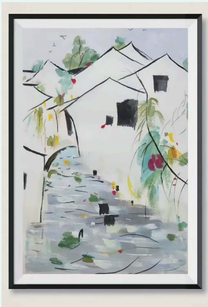
美丽江南 一实校城南校区 四(8)班 曹梓睿