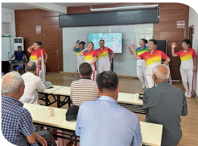
为弘扬中华民族爱老、敬老的传统美德,近日,海航社区新时代文明实践站开展“父爱如山 情暖社区”演出活动。