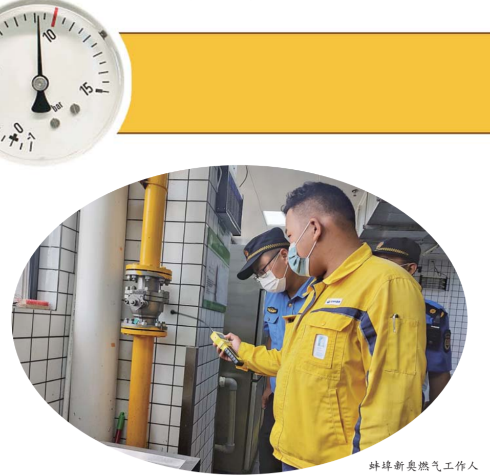
蚌埠新奥燃气工作人员对燃气设备进行检查。

在房屋装修时,切勿随意拆改和包裹燃气管道和设施,不要在燃气管道和设施上悬挂杂物,避免管道接口松动漏气。“燃气使用