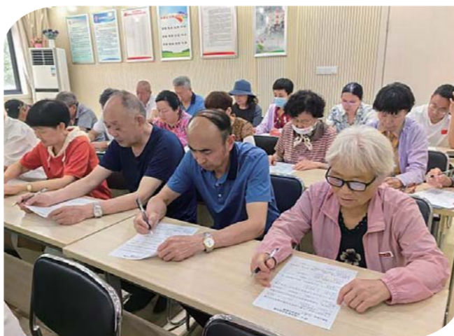
近日,蚌山区湖滨社区中心菱湖社区在社区新时代文明实践站开展“红色信念在我心”党史知识竞赛,让社区党员们在比赛中深化认识学习党史的重要意义。