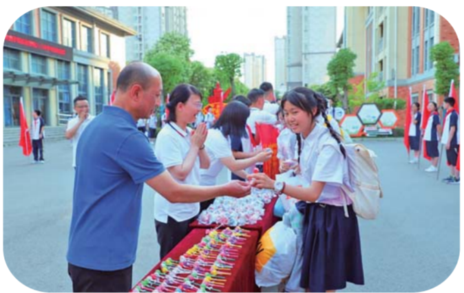
中考前夕,蚌埠市龙子湖实验学校九年级学生和老师们齐聚操场,举行“雄鹰展翅 决胜中考”出征仪式。