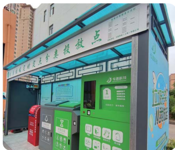
标准四分类的垃圾分类投放点