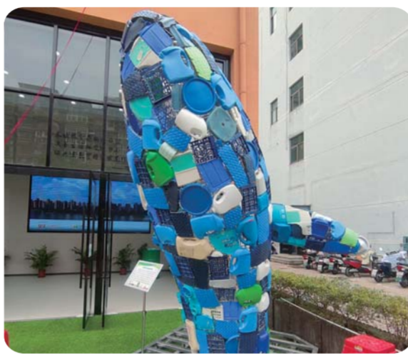
废旧塑料做成的鲸鱼造型十分醒目