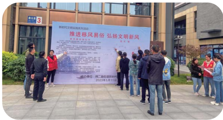
居民积极弘扬文明新风。

引导广大群众深刻认识到移风易俗的必要性与重要性,主动摒弃大操大办、人情攀比等陈规陋习。 活动现场设置以“推进移风易俗 弘扬文明新风”为主题的展板,参与活动的群众纷纷表示,要积极践行承诺勤俭节约、健康的生活方式。 “下一步,纬二路街道将把移风易俗普及与健康教育、文化表演、理论宣讲等活动结合起来。”纬二路街道相关负责人表示,将继续发挥志愿者、身边榜样、党员干部等引领示范作用,以多种形式调动群众参与移风易俗的积极性、主动性。