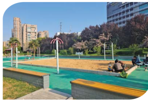
人工沙池区域是孩子们的乐园。