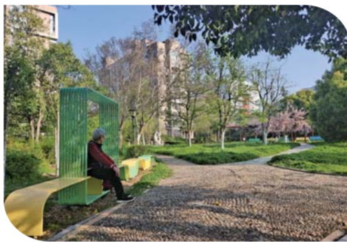
居民在友谊广场休闲。