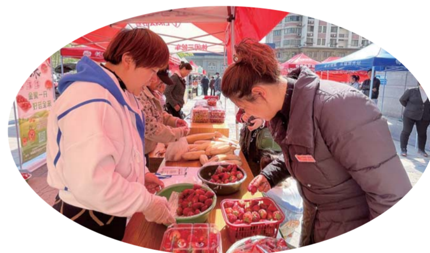
市民在选购农产品。

本报讯(融媒体记者 闻然)“香甜可口、现摘现卖的小番茄,走过路过不要错过!”4月7日,百大购物中心(宝龙店)邻里节的集市广场上,来自怀远县古城镇三巷村、草寺村的村民化身农产品“推介官”,接地气的农产品介绍、有趣的乡间故事,吸引了众多市民驻足选购。