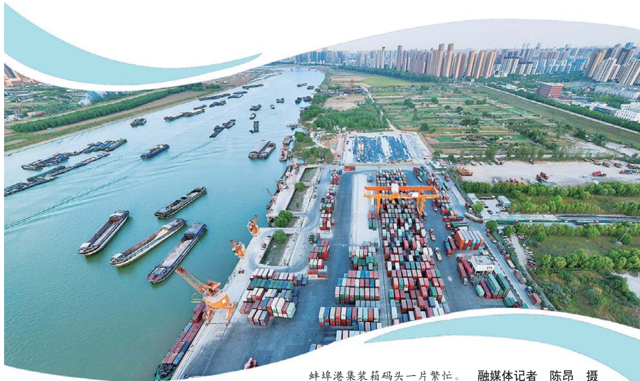
蚌埠港集装箱码头一片繁忙。

记者从市地方海事中心获悉,目前,全市共有水路运输企业168家,经营船舶3138艘、731万载重吨,其中集