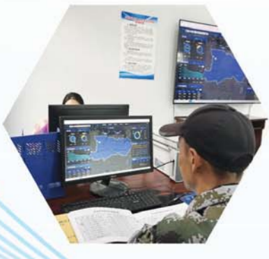
农村厕所长效智能管护平台正在运营。