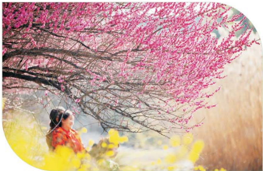
雪华风荷游园红梅绽放,迎春花开,一派春日美景图。