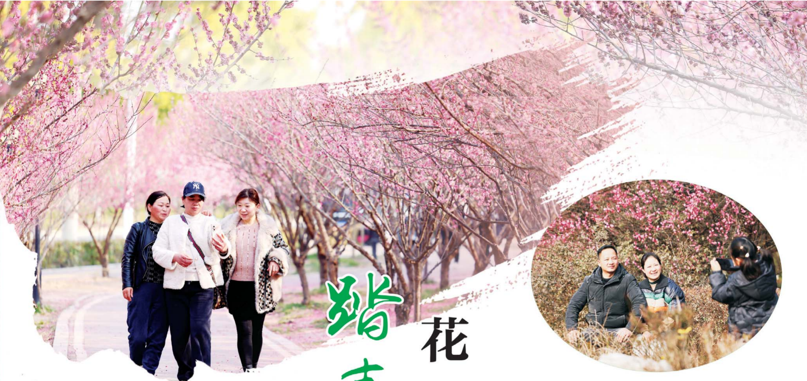
市民在梅园游玩赏花。