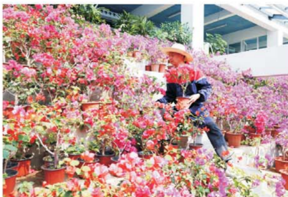
市园林苗圃花房内培育的鲜花争奇斗艳。