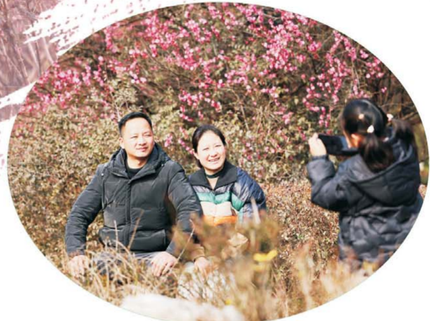
日前,市民在花前拍照留念。