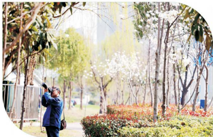
市民在路边拍摄春天美景。

春风和煦,气温回暖,珠城大地一切都显得那样生机勃勃,游园的丛丛花朵,田野间的一草一木,枝头上婉转鸣叫的鸟儿,这些都仿佛在告诉你,快出门踏青吧! 近日,记者驾车前往我市的游园景点及田野间,用相机记录下这美丽的时刻。