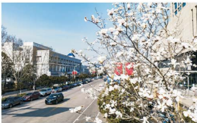
曹凌路上玉兰花进入盛花期,在蓝天的衬托下格外美丽。