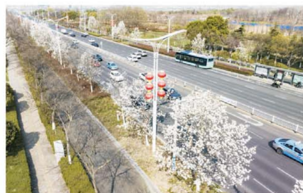
东海大道龙湖大桥东段,道路两旁玉兰绽放。