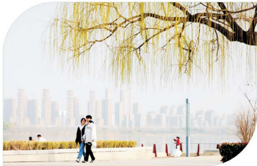
市民在龙子湖公园散步赏景。