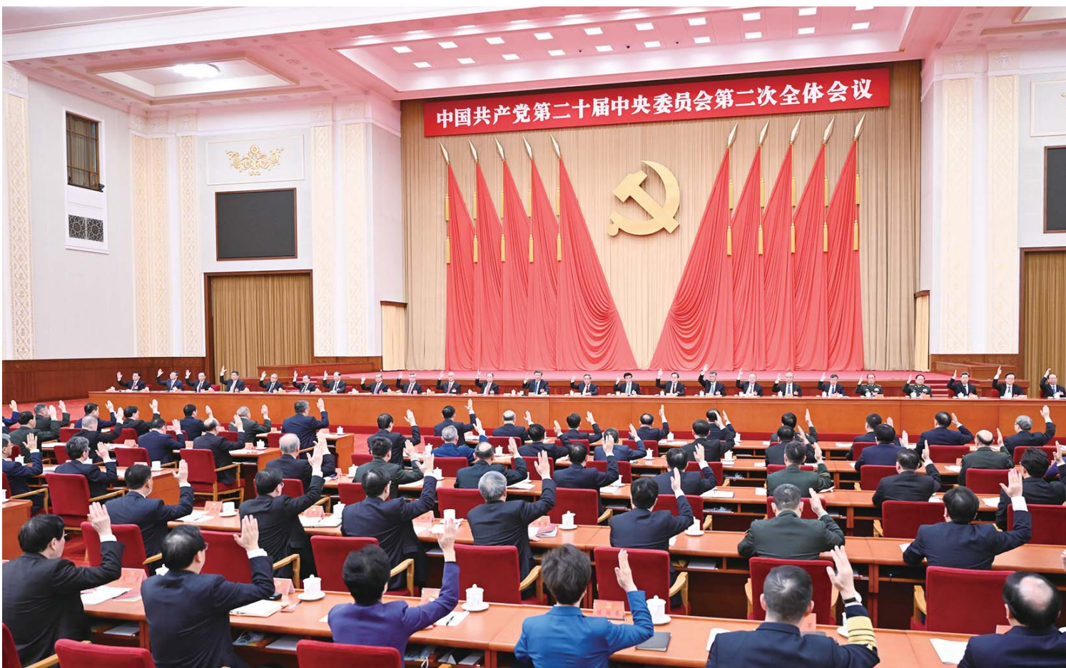
中国共产党第二十届中央委员会第二次全体会议,于2023年2月26日至28日在北京举行。中央委员会总书记习近平作重要讲话。