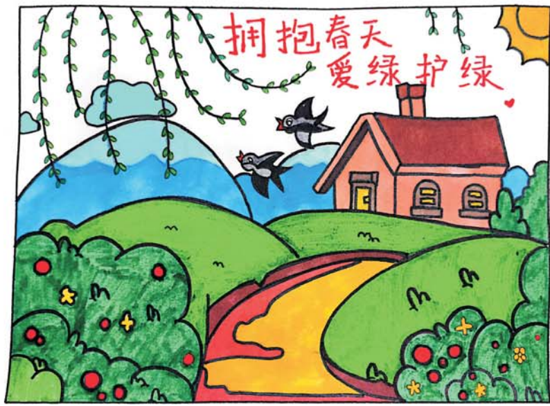
水游城学校 三(1)班 李孜默

翩起舞。 秋天,有些树木已经褪去了绿色的外衣,换上了金色的纱裙。一阵秋风拂过,一片片叶子飘落在大树妈妈的脚下,铺上了一层彩色的地毯。学校的菜园里,别有一番风景:翠绿的黄瓜顶着黄花挂满枝架;西红柿的果实又大又红,像一个个小灯笼;青红辣椒挨挨挤挤,好像在开大会。 冬天,洁白的雪花悄无声息地落下,整个校园都因为它的到来而披上了一层厚厚的银装。最具特色的是学校玉兰大道两旁笔直的玉兰树,精神抖擞地在寒风中傲然挺立,像一个个士兵保护着我们的校园。 这就是校园里如诗如画的四季,它为我们的童年增添了许多别样的色彩,你也同我们一样爱上这儿了吗? 指导老师:曹月月