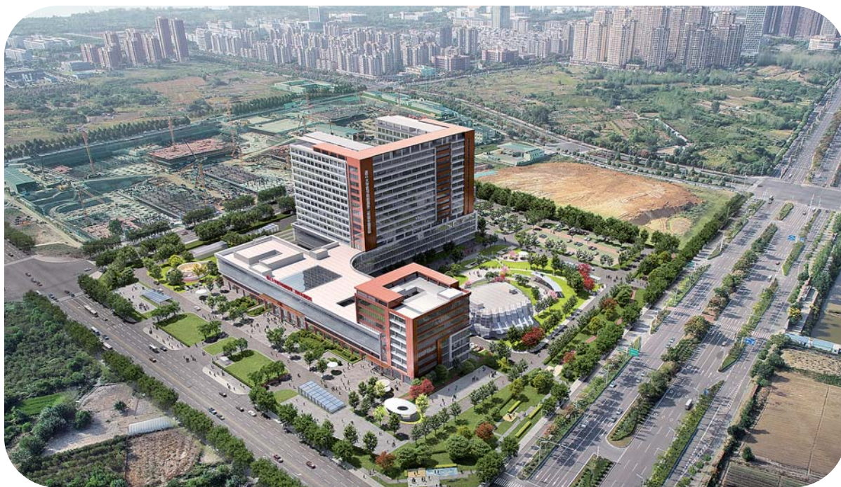
浙江大学医学院附属第二医院安徽医院效果图。

面对企业实际困难，住建部门其实已有办法——从“工程建设项目分阶段办理施工许可”到“验收即拿证”改革，越来越多流程再造、程序优化正在为企业节约更多时间和成本，保障项目快速实施，早日建成。