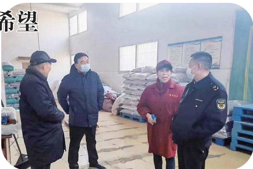
开展春季农资市场专项检查行动，确保农资质量。