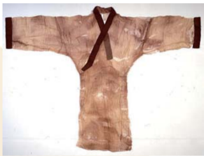
西汉直裾素纱襌衣。(资料图片)

都不输于现代人。1971年马王堆古墓中出土的西汉直裾素纱衣惊艳世界，也正是从这个时候开始，汉服文化开始影响周边国家，无论是高句丽还是日本，从他们现在所遗留的历史服饰来看，其根源都来自我们的汉服。