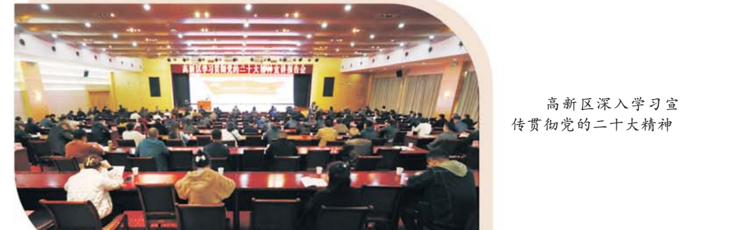
高新区深入学习宣传贯彻党的二十大精神

坚持不移抓好党风廉政建设。 出台《高新区加强“一把手”和领导班子监督任务清单》和《高新区党工委贯彻落实〈党委(党组)领导班子或成员履行“一岗双责”推进全面从严治党若干规定〉任务清单》，督促各方面严字当头，严防乱作为、严管所措。全面落实市委巡察整改任务，党工委召开专题会议研究部署，提级统筹推动市委巡察天河科技园、秦集镇反馈意见整改工作。支持纪检监察工作，全面完成纪检监察协作区建设。全年贯通运用监督执纪“四种形态”处置问题线索89件，处理44人次，营造了风清气正的良好政治生态。