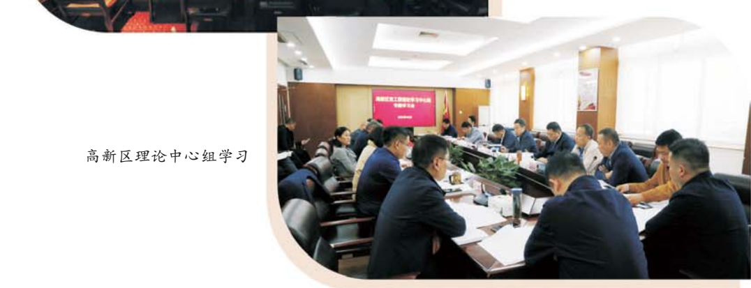
高新区理论中心组学习