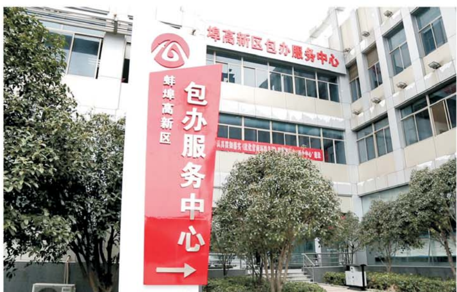
高新区包办服务中心