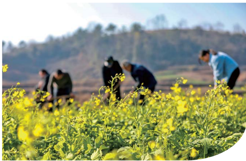
1月30日，村民在贵州省黔西市莲城街道老鸹河社区地区里劳作。