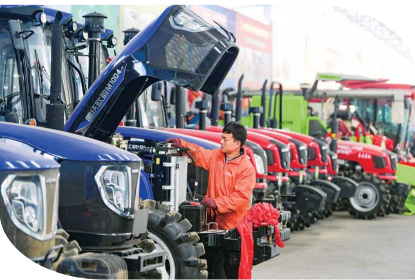
近日，各地纷纷开展春耕备耕各项工作，为新年的农业生产打好基础。1月29日，在江西省赣州市章贡区一家农机公司仓库内，工作人员在对拖拉机进行检修和保养。