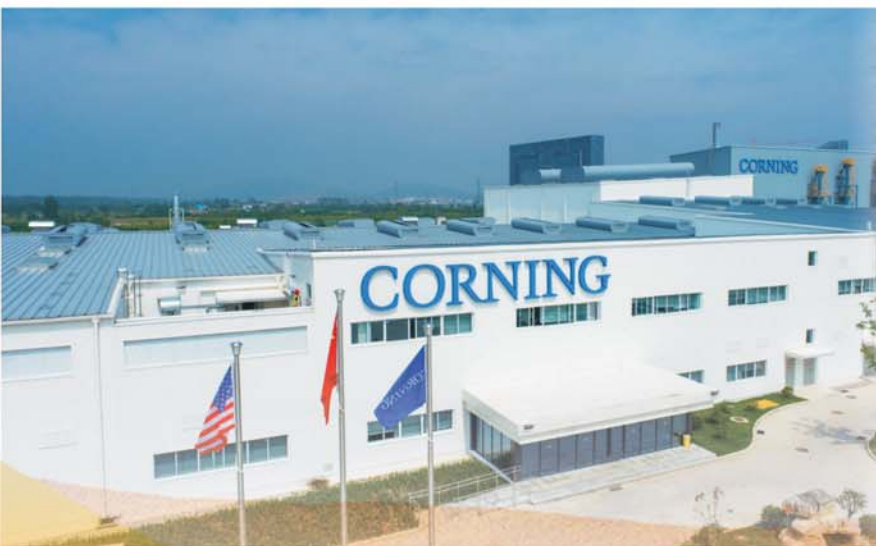
康宁药用玻璃项目外景