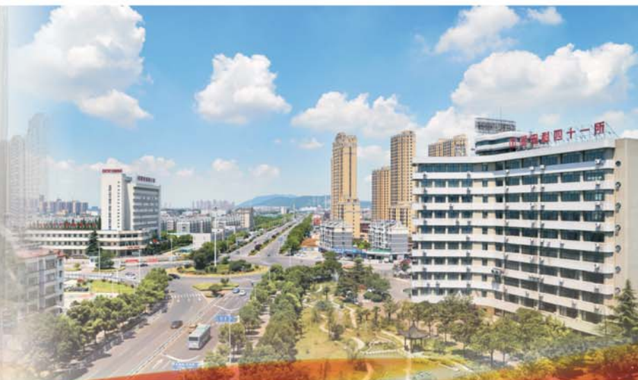
中国电子科技集团公司第四十一研究所外景