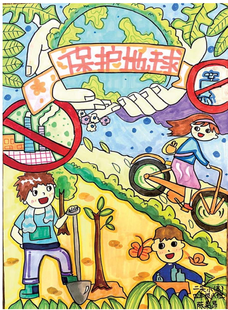
二实小 四(8)班 陈秉昂