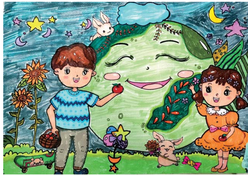
二实小 三(8)班 田禹承