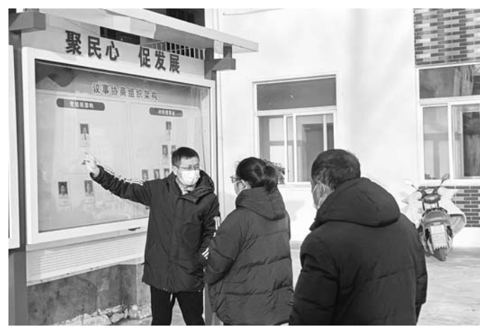
今年以来,淮上区沫河口镇大柏村认真开展民主议事协商工作,并公布于众,得到群众的信赖。

活动期间,共开展各类执法检查30余次,检查道路运输企业7家,水路运输企业10家,对140余艘进港船舶、200余辆出租车进行了宣传、监管,切实提升交通运输行业安全水平。