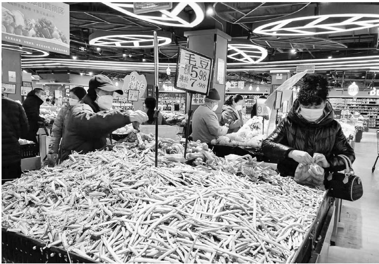
市民在超市挑选蔬菜。

图)我市近日开启“速冻”模式，再加上一些市民为了减少外出的机会，会囤一点蔬菜、水果，这对大家菜篮子供应是否有影响？记者昨天从蚌埠海吉星农产品物流有限公司获悉，近期，我市每天蔬菜供应量可达1350吨左右，水果供应量1200吨左右，市场供应充足，总体保持量足价稳。