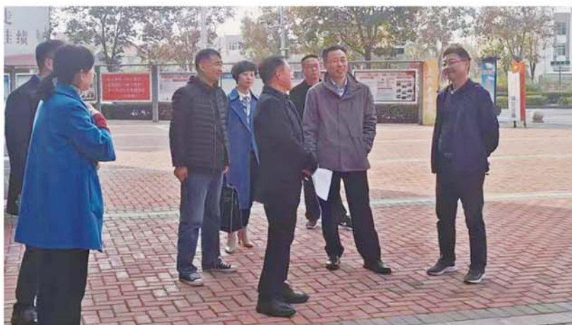
市人大常委会调研基层人大代表工作室建设

从年初至岁末,时间见证了禹会人民奋发向上、永不停歇的脚步。今年以来,该区人大常委会、区政协坚持守正创新提质增效,砥砺前行,勇于拼搏,自觉把人大、政协工作放在改革发展大局中来谋划推进,充分发挥人大、政协职能作用,同心同德同行,合力合力合拍,为禹会区经济社会高质量发展贡献重要力量。