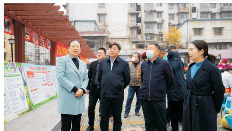
禹会区政协调研纬四街道文化长廊建设