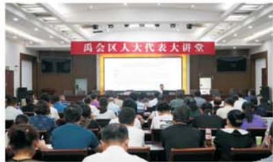
禹会区人大代表大讲堂

民生无小事,枝叶总关情。近年来,禹会区人大常委会积极探索,把一件件体现民心、惠及民生的“小事”嵌入代表票决制度体系,汇聚成体现人民民主的“大事”,逐步形成了“全过程”的制度规范,实现了民生实事项目从“为民作主”到“由民作主”的历史性转变,以实际行动彰显了“全过程人民民主”的勃勃生机。