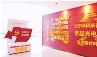
禹会区党群服务中心