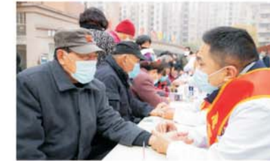
“禹您协商,送健康进社区”活动

四街道报送的课题,组织教科文体、港澳台侨联络2个专委会,共同开展“禹您协商,送健康进社区”活动,通过义诊及健康知识的宣教,当天共有100余名居民接受了义诊和医疗咨询。组织委员围绕长青乡民宿建设、区域内学校民转公后教学质量、乡街老年食堂选址等民生关切开展“禹您协商”系列民主监督活动12次,200余人次委员参加,通过将听取情况介绍与深入基层调研相结合,查找问题短板、提出对策建议,形成包括《禹会区民宿经济发展的建议》《八里沟生态环境治理调研报告》《加快培育基础教育龙头学校》在内6篇高质量调研报告。