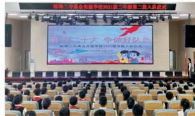
蚌埠二中禹会实验学校综合报告厅