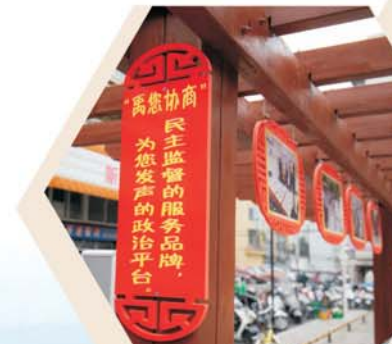
纬四街道文化长廊