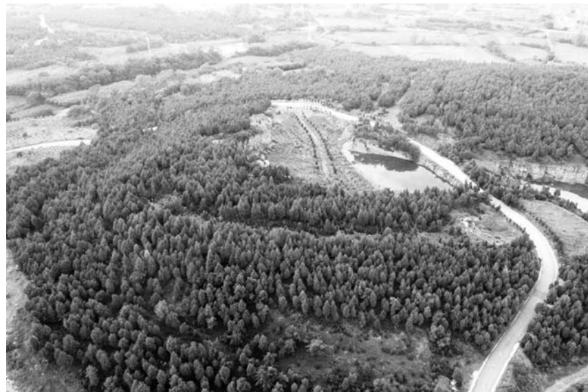
曾经满目疮痍的大洪山，如今又披上了绿装。